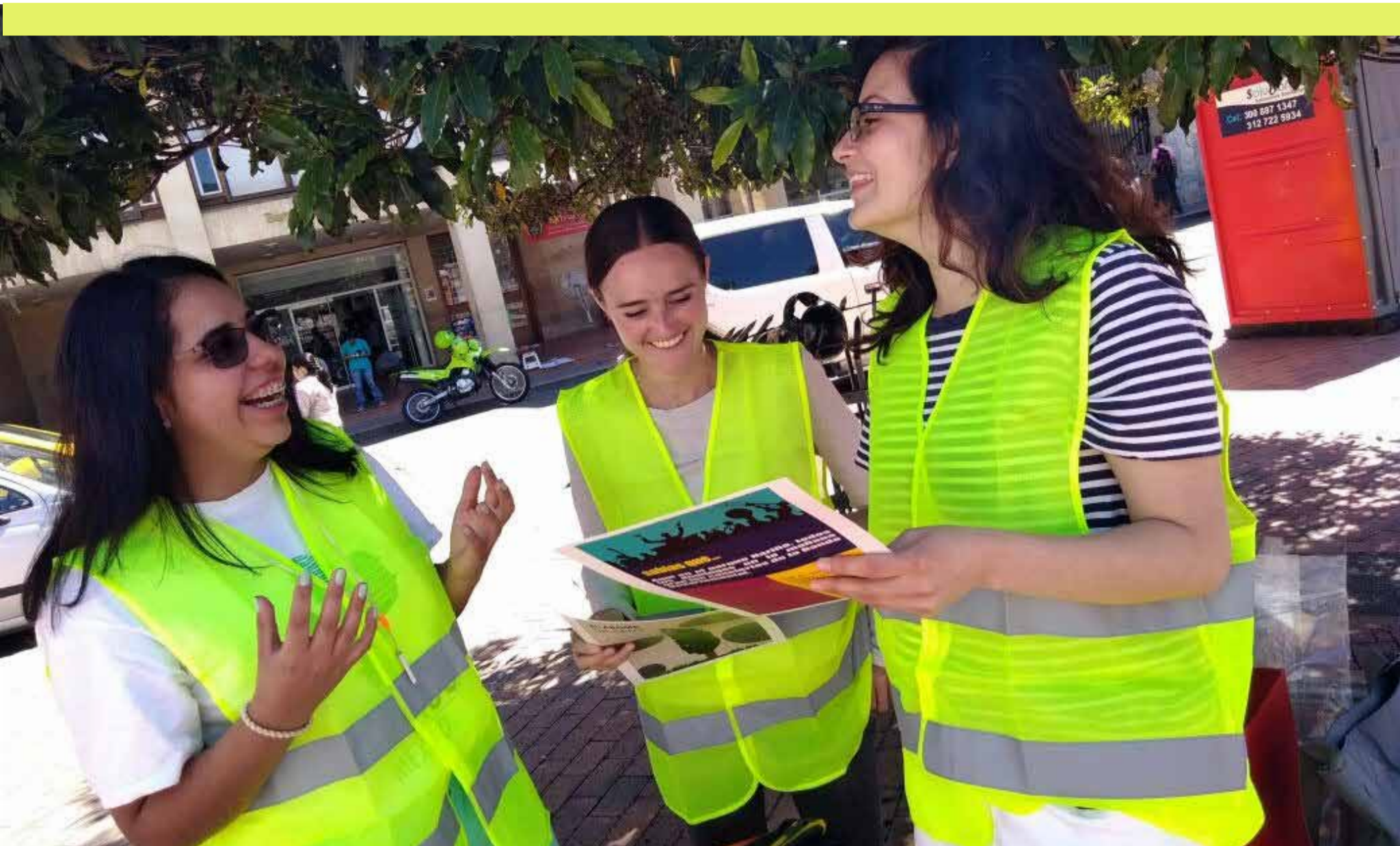
Taller Hazlo Tú Mismo - Bicivilízate Pasto, 2017

Las siguientes herramientas hacen parte del proceso de diseño, fortalecen cada una de sus fases permitiendo obtener nueva información, trabajar en equipo, construir soluciones y abrir espacios participativos donde usuarios y comunidades están implicados. Durante el proceso se debe tener en cuenta la escala de medición que repercutirá en el