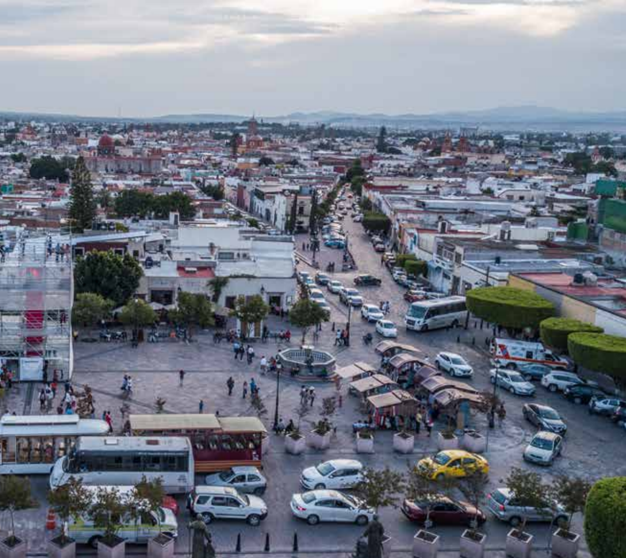
Abriéndola al acceso de todas y todos. México, dérive LAB

des, al beneficio de la ciudadanía (objetivos y metas mayores con un impacto más allá de la mera intervención).