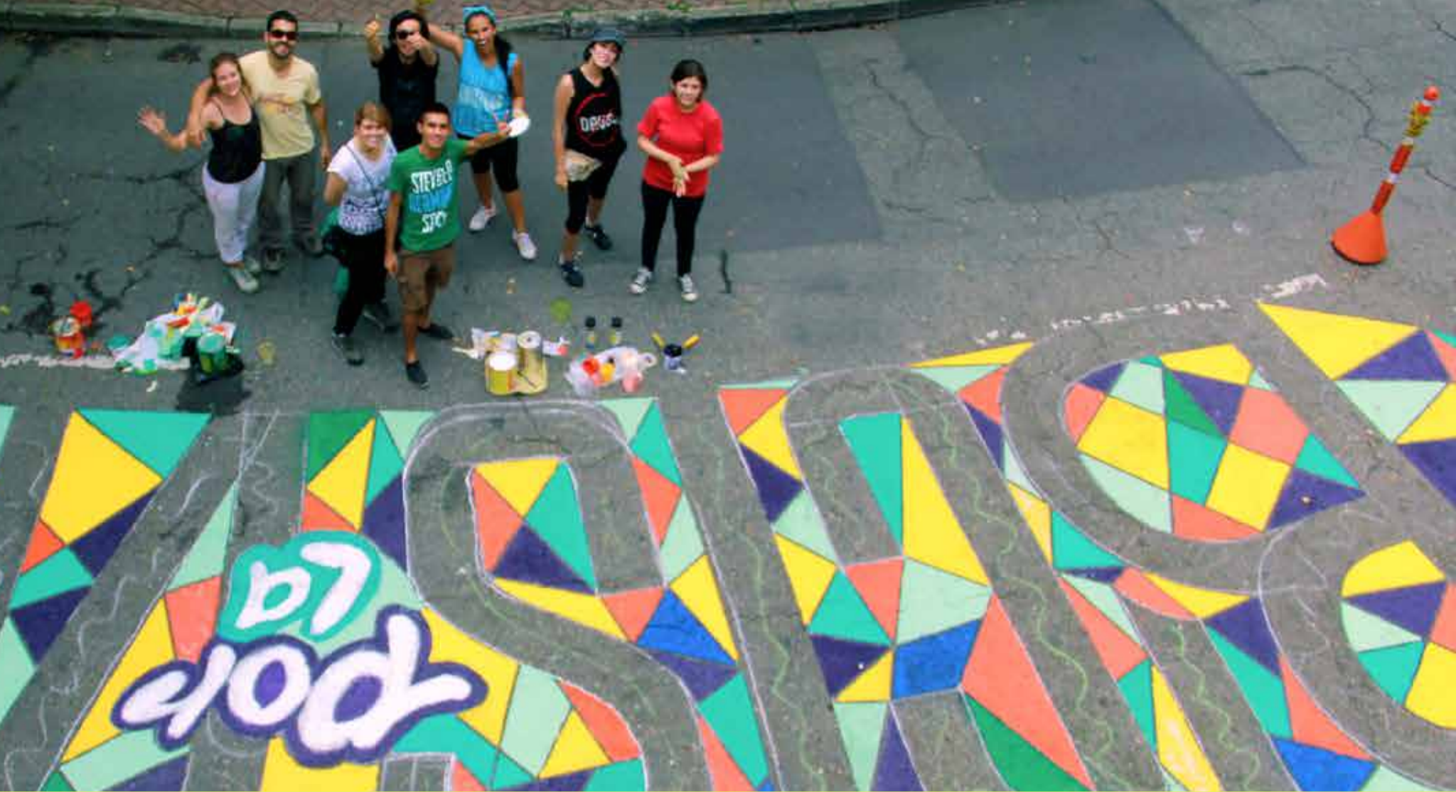
#BicisPorLaVida, La Ciudad Verde y Teatro Pablo Tobón, 2014

Acción: Juegos: Pintar juegos en la calle para promover el uso y la activación de este mediante la estancia de niños.