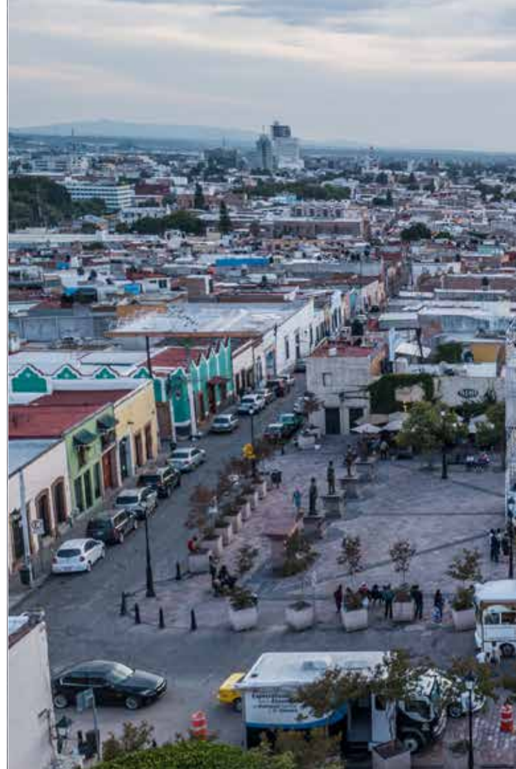
#MonumentoQro: Intervención efímera para rescatar la mejor vista de la ciudad y po